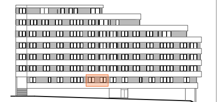
ALZADO PARQUE MARUXA MALLO