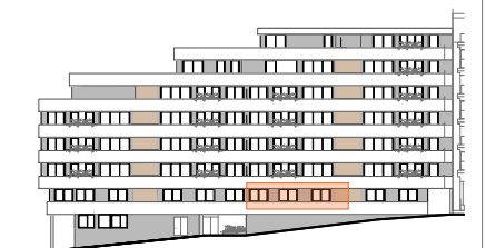
ALZADO CALLE DIEGO SARMIENTO ACUÑA