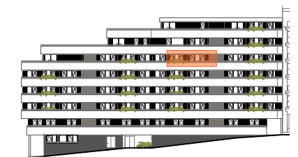
ALZADO CALLE DIEGO SARMIENTO ACUÑA