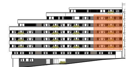
ALZADO CALLE DIEGO SARMIENTO ACUÑA