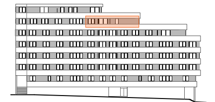
ALZADO PARQUE MARUXA MALLO